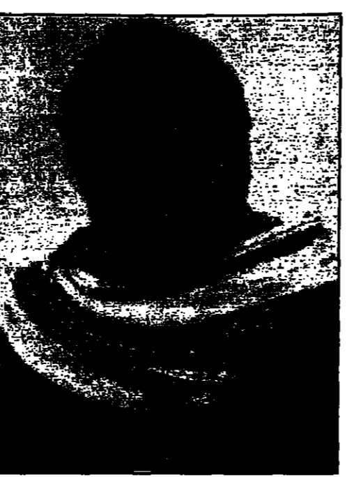
الشهيد يحيى عياش